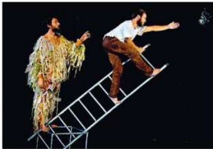
In equilibrio Una scena di «Dall'alto. Prova ancora. Cadi di nuovo» adatto a partire da 8 anni

Singolare la genesi della partitura musicale di Nova: il compositore racconta, infatti, di aver letto il testo beckettiano e sognato di essersi trasformato nel suono di tre uccelli che comunicano con gli altri animali della foresta. Dalla suggestione onirica è nato il desiderio di registrare con il cellulare i propri suoni durante il sonno ed elaborare il materiale raccolto in com-