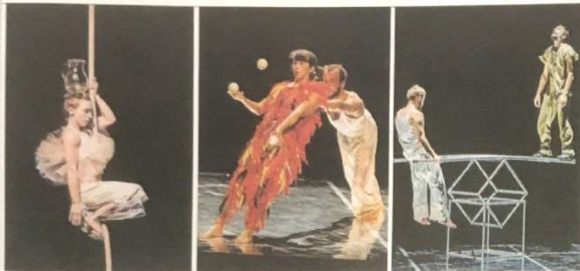
IL CIRCO CONTEMPORANEO